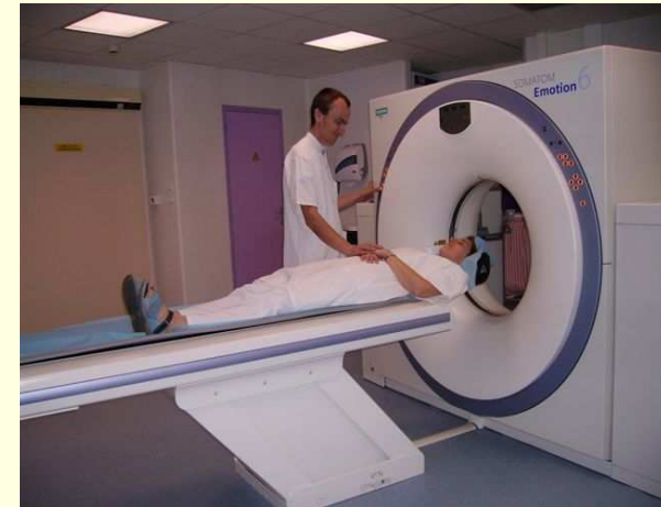
Depuis 2004, le CH de SEDAN dispose d'un scanner