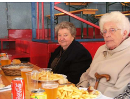
Le temps d'un repas

Flâner entre les stands et les étalages, prendre un bon repas sur le champ de foire, redécouvrir les métiers de nos campagnes et les animaux de ferme, autant de petits riens qui tiennent une grande importance dans le quotidien parfois édulcoré des personnes âgées.