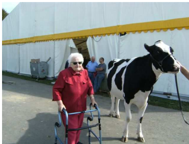
Comme un air de campagne en plein centre ville ...

La 74 ème foire commerciale, artisanale et agricole de SEDAN a donné l'occasion à certaines de nos têtes blanches de la maison de retraite de FLOING de s'évader une journée dans les rues de la ville.