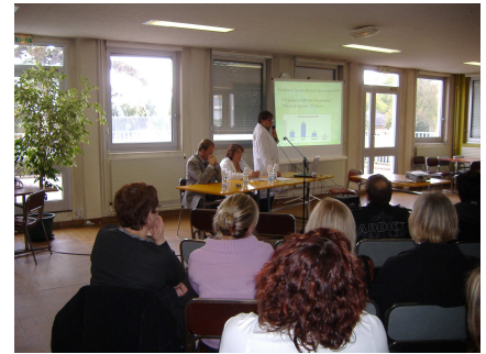
Présentation des résultats aux personnels

Au second chapitre, celui des « ressources