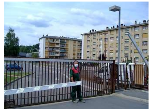
... et les accès sécurisés

Général Marguerite pour tout le monde, y compris le personnel. Ce dernier a bien évidemment joué le jeu selon un scénario précis : les premiers cas de grippe sont signalés sur le secteur et déjà les premières victimes se présentent aux portes des urgences. Immédiatement, pour éviter tout risque de propagation du virus, diverses dispositions sanitaires sont mises en place. Ainsi les entrées sont filtrées et une équipe médicale spécialement formée assure l'accueil des visiteurs afin de détecter d'éventuels nouveaux cas, notamment à travers les réponses à un