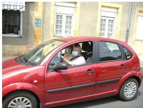
Du sérieux et de la bonne humeur !!!

Ces « grandes manœuvres » ont permis de détecter quelques points de détail à améliorer.