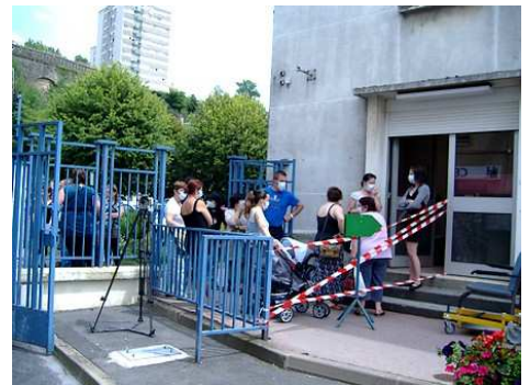
Les entrées étaient filtrées ...

questionnaire. Ensuite des fléchages ont été mis en place pour obliger les