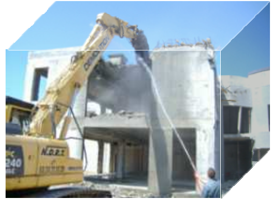
Les pelleteuses ont également fait disparaître le bureau des entrées

La réalisation de ce projet d'envergure a transformé le cœur de l'hôpital en un immense chantier