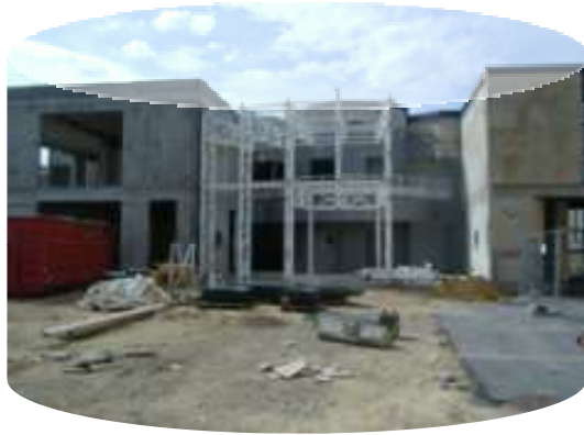
Les structures du hall d'entrée ont été soigneusement démontées