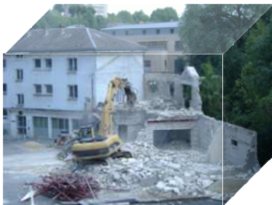
Le bâtiment administratif a été le premier à subir les assauts des pelleteuses de démolition

Et pour jeter un coup d'œil sur un passé pas si lointain et se remémorer les premiers mois du chantier, rien de mieux que des photos évoquant les premiers travaux.