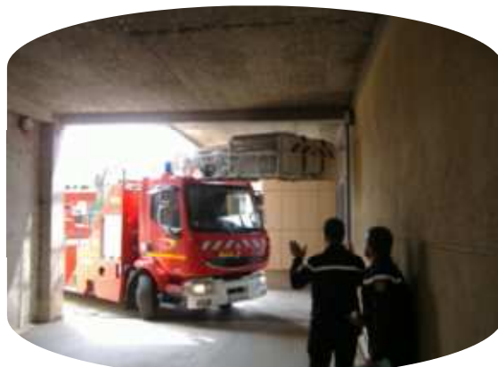
Sécurité OK : la grande échelle des pompiers peut passer sous le porche des urgences et ainsi accéder à l'ensemble des bâtiments du Centre hospitalier